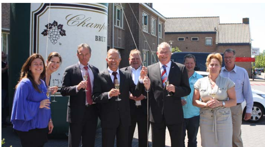
Gemeente Kaag & Braassem en Cyclus proosten op de samenwerking.