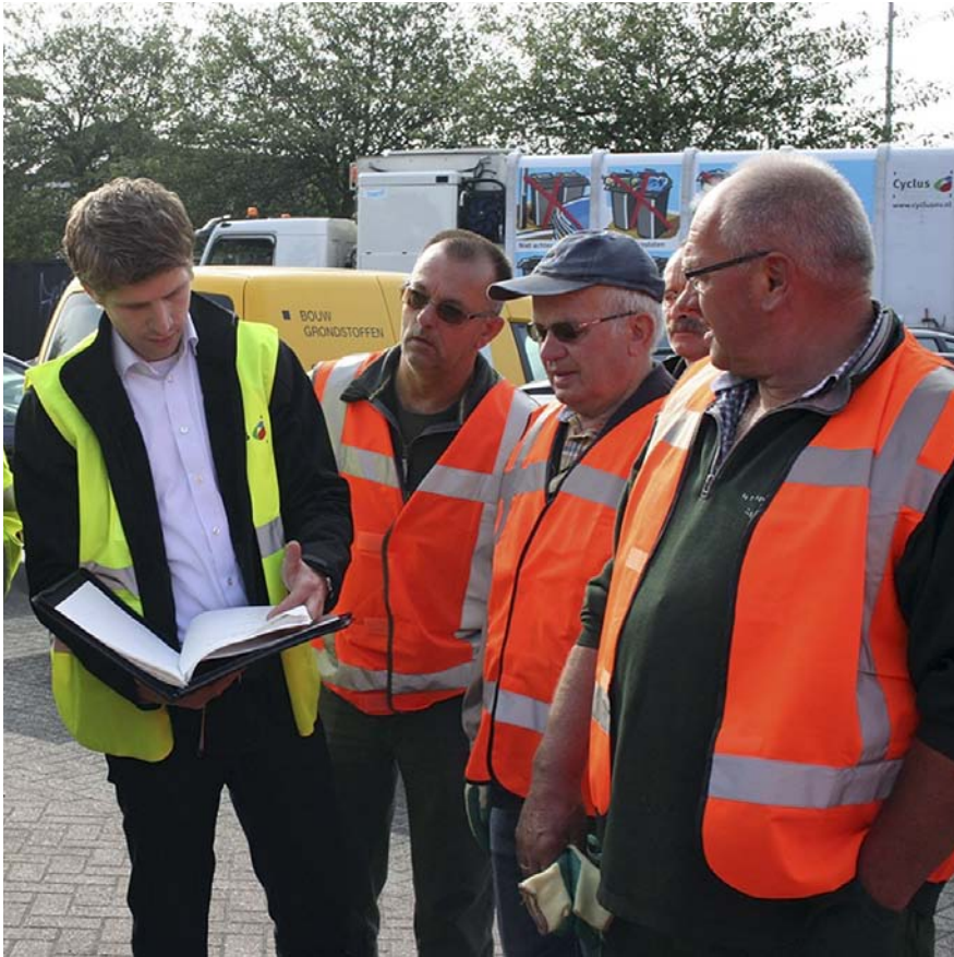
Op 28 mei jl. gingen de vrijwilligers in Vlist na de praktijkinstructie voor het eerst van start met het legen van de minicontainers voor papier.