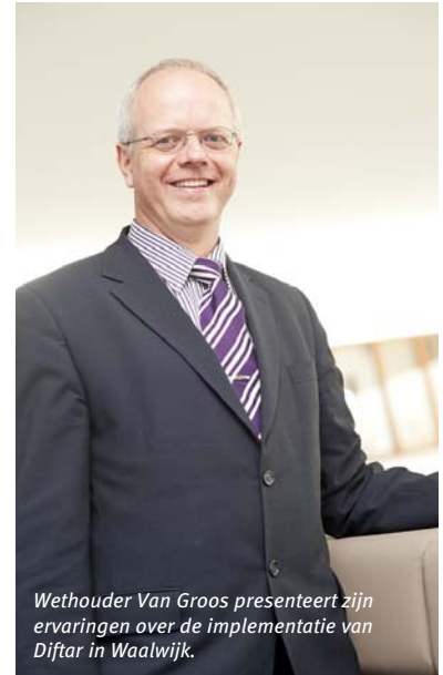
Wethouder Van Groos presenteert zijn ervaringen over de implementatie van Diftar in Waalwijk.

Na een uitgebreid buffet neemt de volgende spreker ons mee in de wereld van papier. Zwoegend loopt een vrijwilliger van een papiervereniging achter een vuilniswagen aan om de straten te ontdoen van dozen vol oud papier; zwaar werk. Dozen vol oud papier zijn bovendien niet echt bevorderlijk voor de beeldkwaliteit en