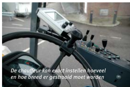
De chauffeur kan exact instellen hoeveel en hoe breed er gestrooid moet worden

Het besturingssysteem slaat alle ritinformatie op in een geavanceerd strooimanagementsysteem. Bos: “Daarin is exact af te lezen welke routes bijvoorbeeld zijn gestrooid, hoe lang elke route duurde