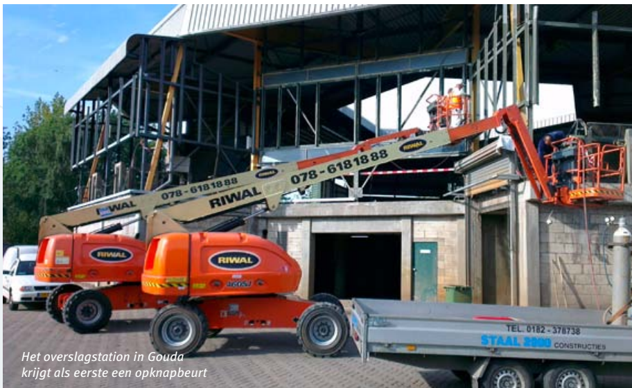
Het overslagstation in Gouda krijgt als eerste een opknapbeurt

der Wolf: “De werkzaamheden in Gouda zijn al afgerond en in Alphen aan den Rijn lopen we voor op schema. Die snelle voortgang is mede te danken aan de constructieve samenwerking met uitvoerende partijen.” Over het toekomstige onderhoud van de overslagstations legt Van Rijn uit: “Vanaf 2013 gaan we werken volgens een nieuw meerjaren onderhoudsplan met een looptijd van tien jaar. De planning van de benodigde werkzaamheden leggen we jaarlijks vast in een jaarplan. Zo waarborgen we dat de overslagstations de komende jaren continu up-to-date blijven.” <<