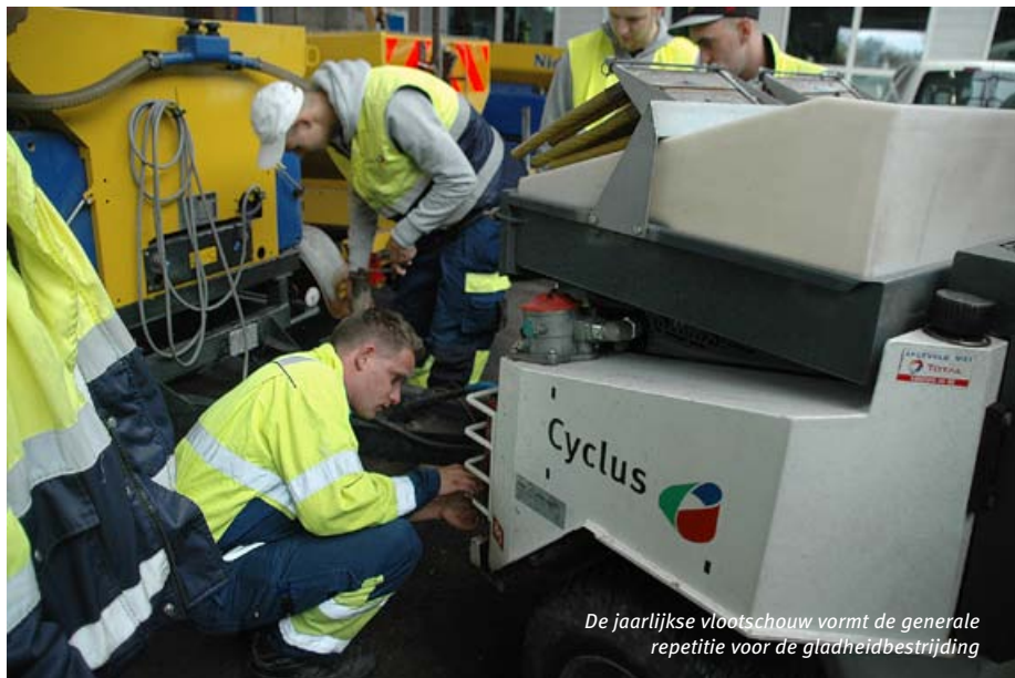
De jaarlijkse vlootschouw vormt de generale repetitie voor de gladheidbestrijding

en hoeveel zout is gebruikt. Bovendien zijn de gegevens van de afzonderlijke wagens ook ‘real-time’ te volgen.” Om te bepalen of het nodig is uit te rukken, volgt Cyclus vierentwintig uur per dag de weersverwachting. Bos: “Daarbij maken we gebruik van de regionale voorspellingen van MeteoConsult. Daarnaast hebben we vorig jaar een eigen meetpunt in gebruik genomen. Daarmee meten we onder andere de temperatuur, luchtvochtigheid en hoeveelheid neerslag op het koudste punt in Gouda. Op grond van al die informatie kunnen we heel nauwkeurig bepalen of een uitruk nodig is.”