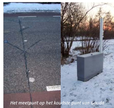
Het meetpunt op het koudste punt van Gouda

men. Ook zijn alle communicatielijnen heel precies uitgewerkt. Dat gaat van sms-alerts bij iedere uitruk en het informeren en adviseren van opdrachtgevers tot een wekelijks afstemmingsoverleg binnen de eigen organisatie. Ook het informeren van overige wegbeheerders en de te volgen procedure bij het inschakelen van extra capaciteit is in het draaiboek uitgewerkt. Zo waarborgen we dat de gladheidbestrijding effectief, efficiënt én veilig plaatsvindt”, besluit Bos. «