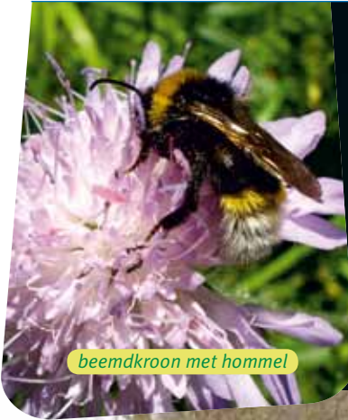
beemdkroon met hommelm