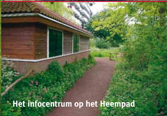
Het infocentrum op het Heempad