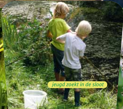
jeugd zoekt in de sloot