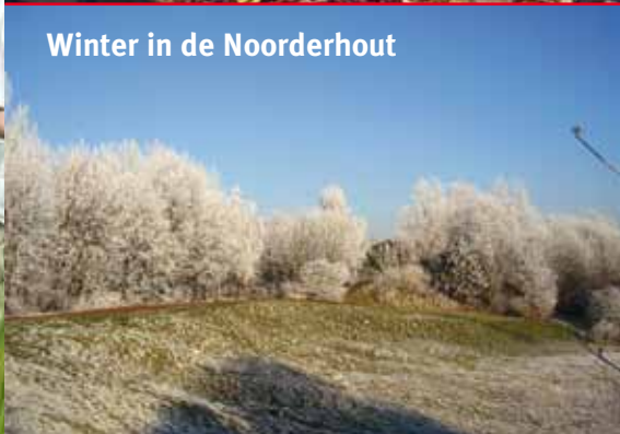
Winter in de Noorderhout